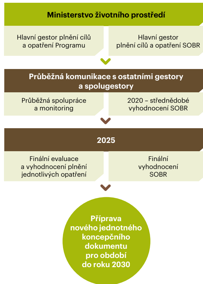
Obrázek 1 – Vyhodnocení plnění Programu

Po schválení Programu vládou jednotlivé resorty z pozice gestorů oznámí Ministerstvu životního prostředí kontaktní místa, která budou zodpovědná za plnění jednotlivých opatření; s těmito místy bude MŽP průběžně komunikovat.